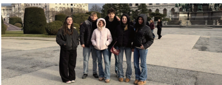
Les élèves en Autriche