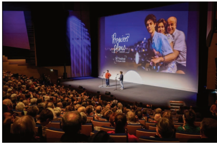
Présentation du film Grand Ciel