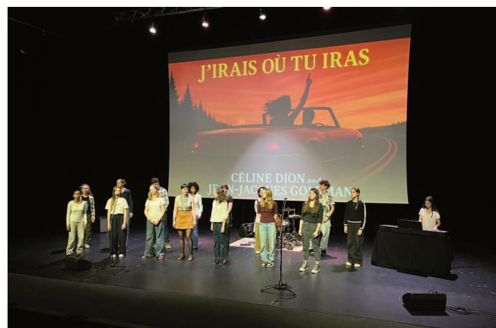
Les membres du club musique