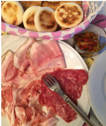
Spécialité italienne de viande séchée

Pendant nos deux semaines de séjour, rythmées par les cours et les visites, nous avons remarqué que les Italiens sont