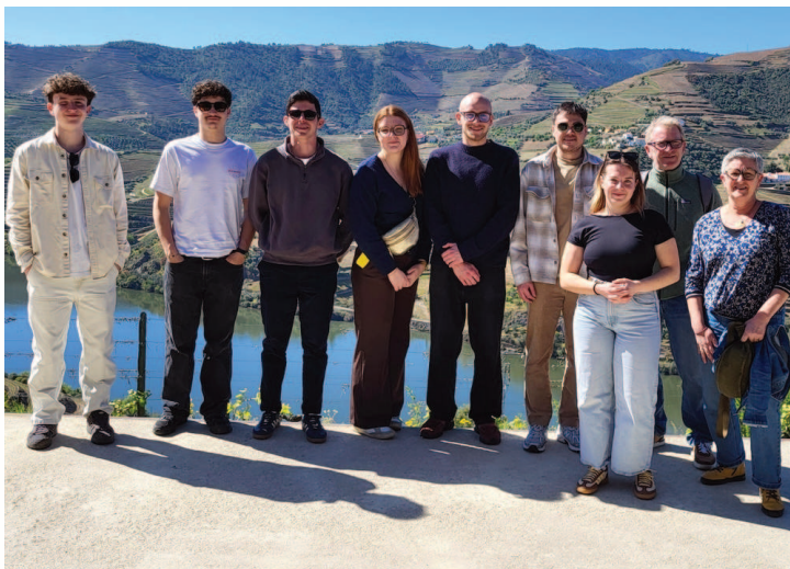
BTS TC 2 en visite à la Quinta do Seixo

La promotion de BTS TC Vins Bières et Spiritueux 24-26 est partie à Porto début avril pour une semaine tournée vers l'international. Le groupe a découvert le vignoble du Douro et les acteurs majeurs du vin portugais.