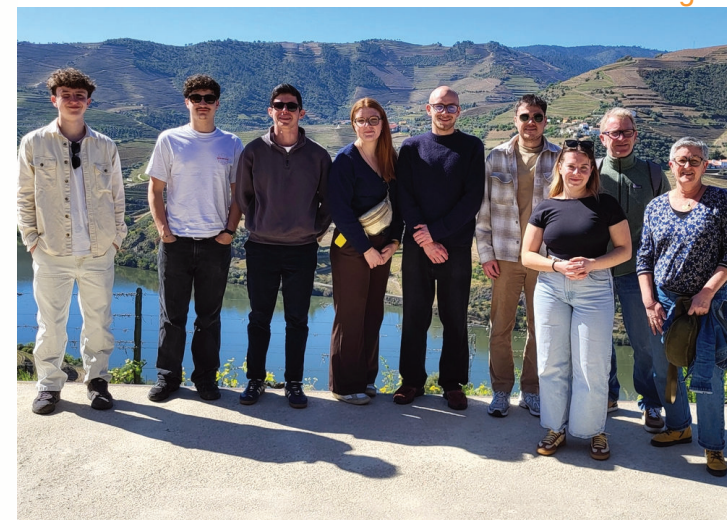
BTS TC 2 Quinta do Seixo

Une semaine d'immersion pour les BTS TC Vins Bières et Spiritueux, au cœur des vins et de la culture portugaise.