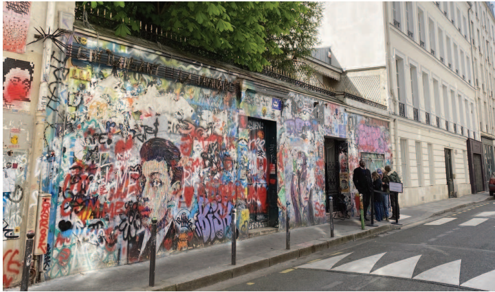
Maison Gainsbourg 5 bis rue de Verneuil, Paris

En poussant la porte d'entrée, le visiteur est directement plongé dans le salon. Le regard se pose en premier sur le piano à queue au centre de la pièce. Il semble que le propriétaire des lieux s'y soit assis il y a quelques minutes. Tout est encore intact et inchangé, jusqu'aux journaux du siècle passé au mur, et aux mégots de cigarettes sur la table basse. La voix de sa fille, Charlotte Gainsbourg, résonne dans nos oreilles et nous guide à tra-