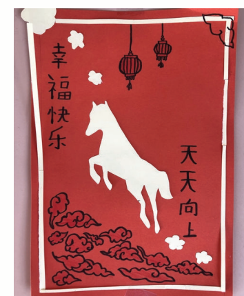
Carte réalisée par les élèves

On a observé un grand nombre de chevaux dessinés sur les cartes, pouvez-vous