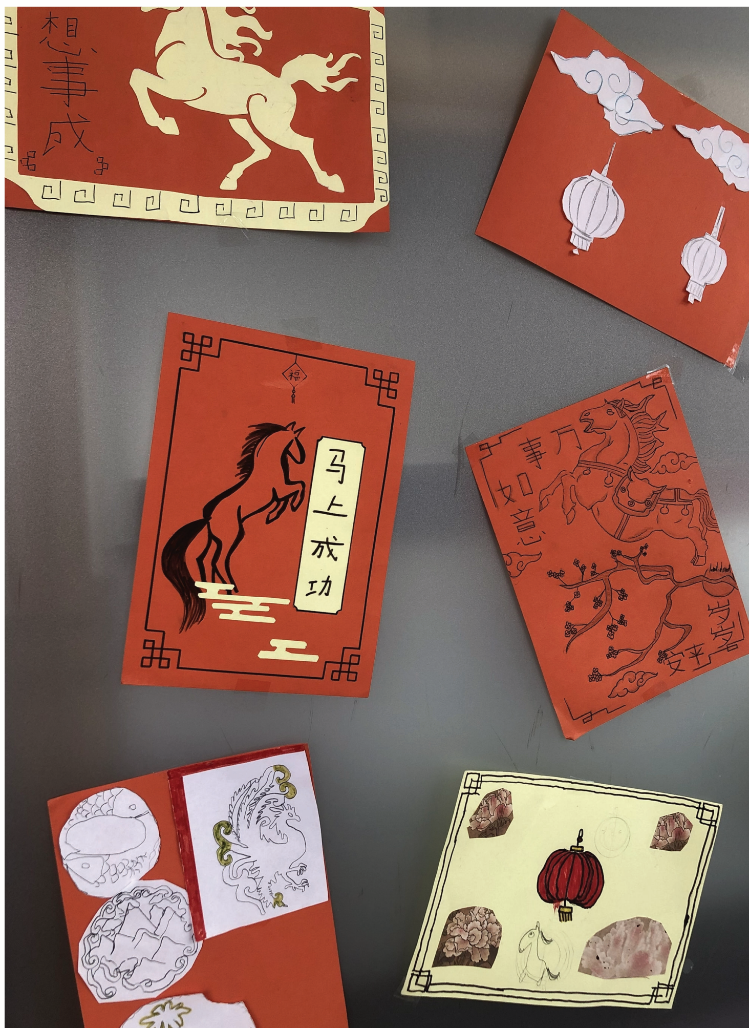
Quelques unes des réalisations des élèves exposées au CDI

La Fête du Printemps, ou Nouvel An lunaire ou Nouvel An Chinois, est la fête la plus importante de la culture chinoise. Elle commence à la deuxième nouvelle lune après le solstice d'hiver, c'est-à-dire le jour le plus court de l'année. Elle dure en moyenne quinze jours, entre janvier et février, et se termine par la fête des Lanternes. Pour l'occasion, les lycéens de la classe ULIS et les élèves de chinois ont réalisé des cartes de vœux pour créer une exposition au CDI.