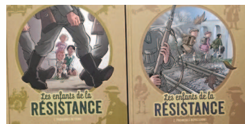
2 tomes de la BD adaptés en film

Face à cela, les enfants vont se réunir pour s'organiser en résistance, sous le nom du Lynx. Faire passer des messages aux habitants, saboter, aider des réfugiés à rejoindre l'Angleterre. Malgré leur jeune âge, ils vont tenir tête à cette armée d'occupation, car ils