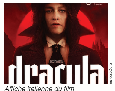
Affiche italienne du film