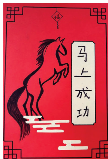
Carte réalisée par les élèves