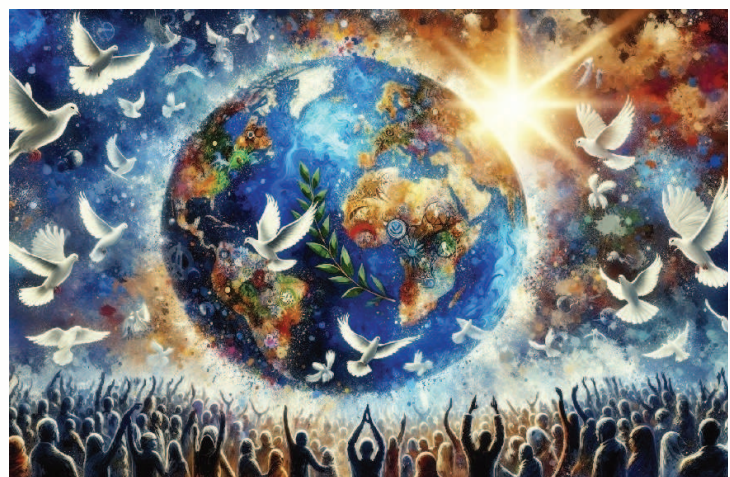
Espérons que l'humain sauve ce qui fait de nous des êtres humains