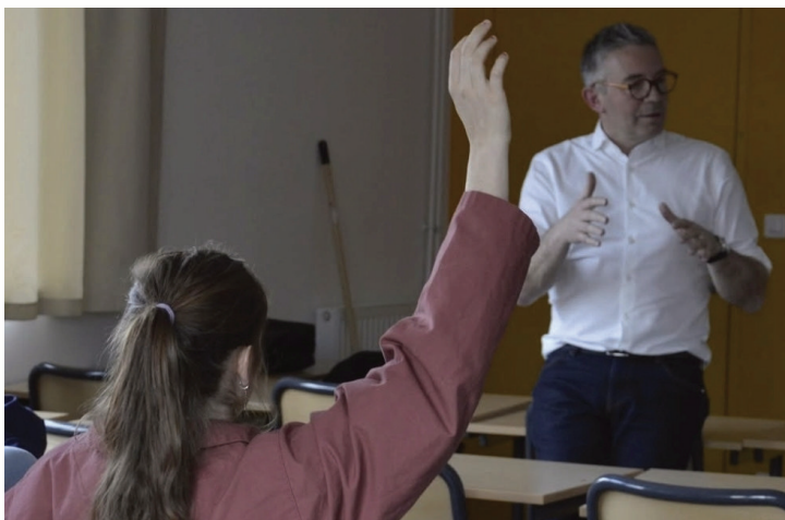
Moment d'échange animé entre un intervenant et des élèves