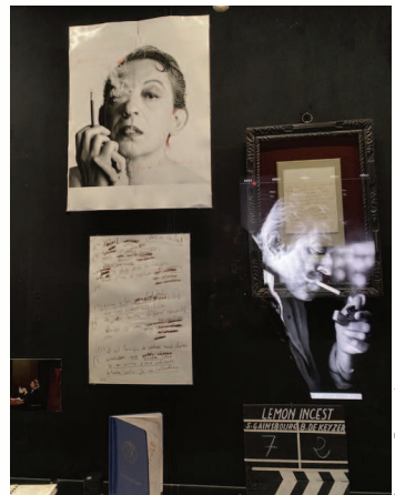
Le musée où sont exposées ses archives personnelles