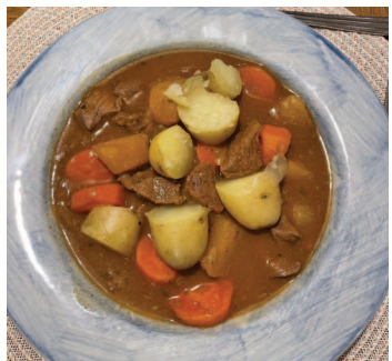
Spécialité culinaire irlandaise

Cahir castle, l'un des plus grands châteaux du pays. Sans oublier les côtes magnifiques de Dunmore East qui ne nous ont pas laissés indifférents.