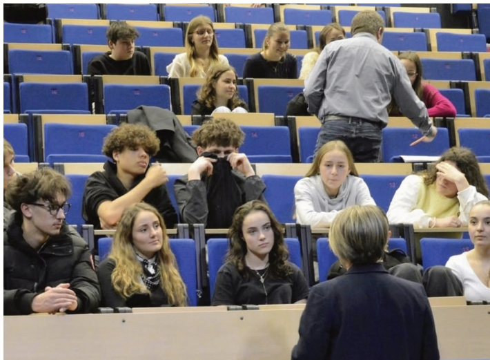
Rencontre en images. Moment d'écoute.

De 16h00 à 17h30, trente professionnels interviennent, répartis dans les salles du bâtiment C. Les élèves se présentent par groupe en évoquant leur projet professionnel. L'atelier est basé sur l'interaction. Le professionnel prend la parole pour évoquer son parcours, l'élève peut alors poser sa question, sur son évolution, par exemple. Les discussions sont riches et intéressantes, la