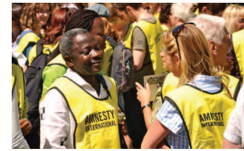
Bénévoles du groupe Amnesty International

« Mieux vaut allumer une bougie que maudire les ténébres »